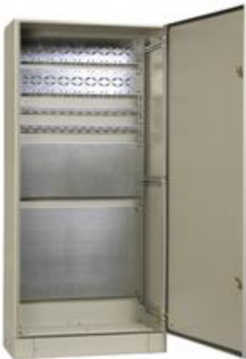
напольные IP31 IP54