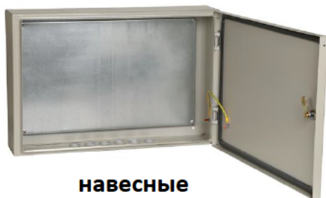
навесные IP31 IP54