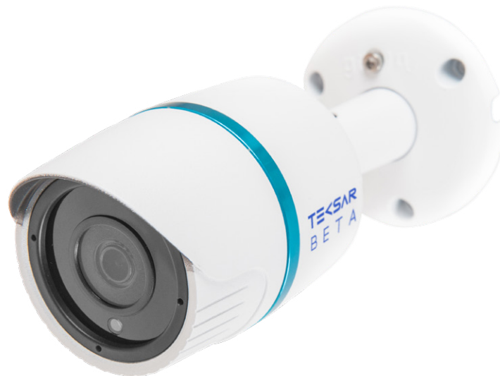
Tecsar Beta IPW-4M20F-poe

уличная IP-видеокамера охранного видеонаблюдения